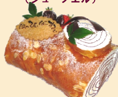
あいがもノエル (シュノーエル)