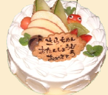
生クリーム デコレーション (フルーツ)