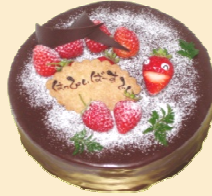
ガナッシュ チョコレオート