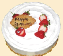
レアチーズケーキ