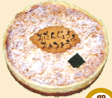
バイクドチーズケーキ