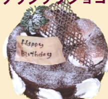
オーガニック クラシックショコラ