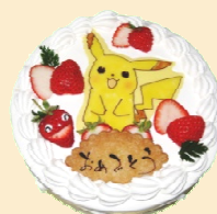
キャラクターケーキ