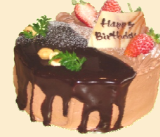
チョコ生クリーム