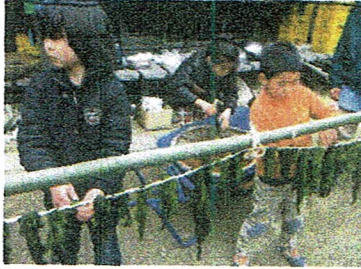
おいしい千疋ワカメ, できるかなあ。

こうじさんと今年度の最後の冒険は 岩だらけの山に登りました。「もとすじ岩に 登りたい」という声も・・・