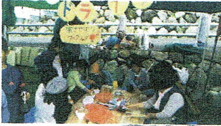
カバン持ちしなから♡