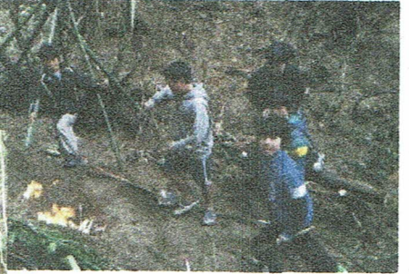
基地でお昼ごはん。おいしいなあ。 テレビにかまどにじゅうたんに...とXOXO 進化!!

てらこや中で基地アム。山に入るの 帰ってこない。よいと思った基地を まねて、みんなの 基地が相乗 効果で進化 していく。ここで キャンプしたい! 夢は ひんがしかなあー。