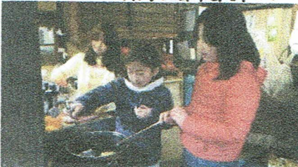
あけだてが最高~! こちらも天カスを作って みんなでつまみ食い♡