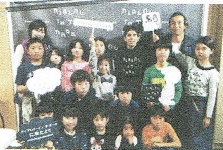
3月7日~9日 大阪へのたび