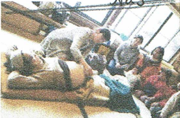
助産師さんのお話。 赤らんのい音は とっても速くてびっくり!

第1部はまずおうちえんの反りごちと しいごち。みんな汗ばかになって走った。 そしておうちえんのみんなにもちまき。 全員とれいばか。最後は年長 さんに手作りペンダントをプレゼント。 裏にはその子に合った絵を描きました