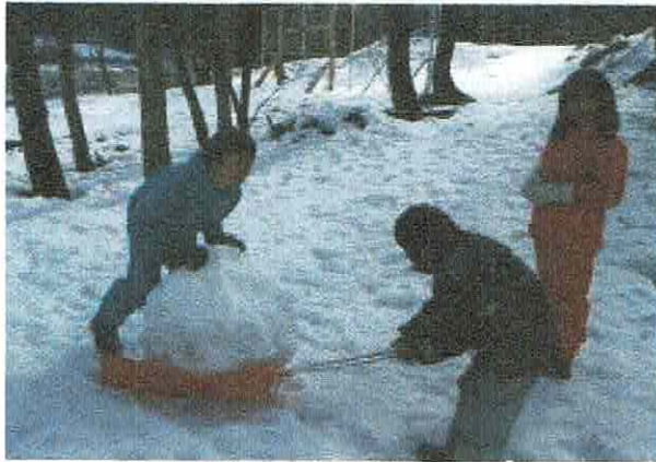
大きな雪のかたまりをソリを使って運ぶR あとで雪だるまになりました！