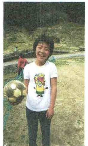
23日(土)にも来て、サッカー ゴールを作ってくれたU。 完成したね!!